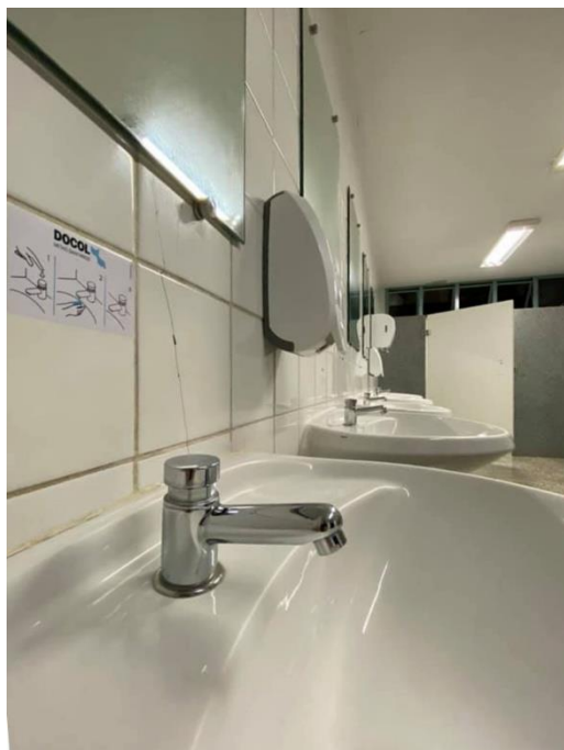
Figura 3 - Torneira automática com acionamento por pressão