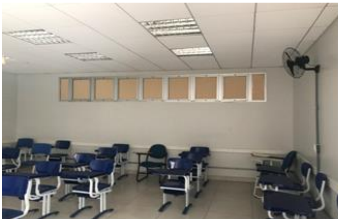
Figura 2 – Foto interna de sala de aulas, na Faculdade UnB Planaltina, evidenciando a necessidade de avaliação técnica das janelas quanto às suas características de ventilação.

* Outra recomendação do COES diz respeito à necessidade de boa ventilação dos espaços. Neste sentido, é necessário que uma equipe técnica avalie este conjunto de salas (Ver figura 2).