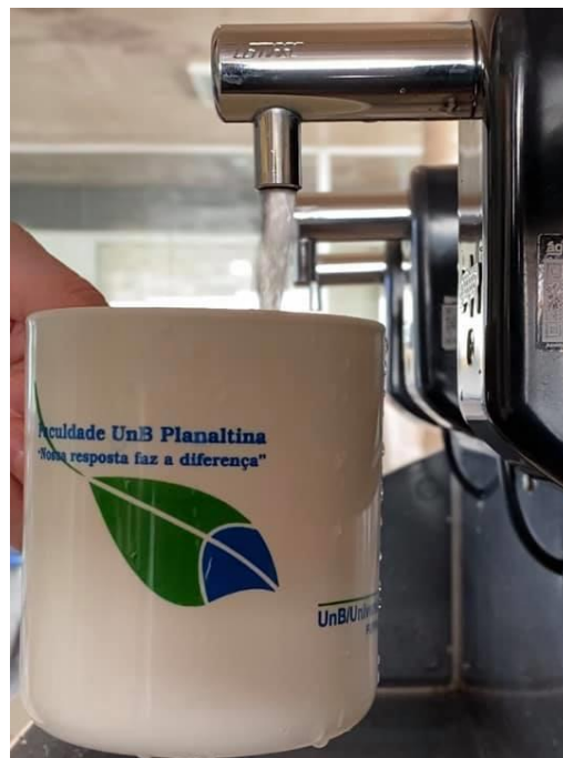
Figura 4 - Torneira com acionamento por sensor em bebedouro