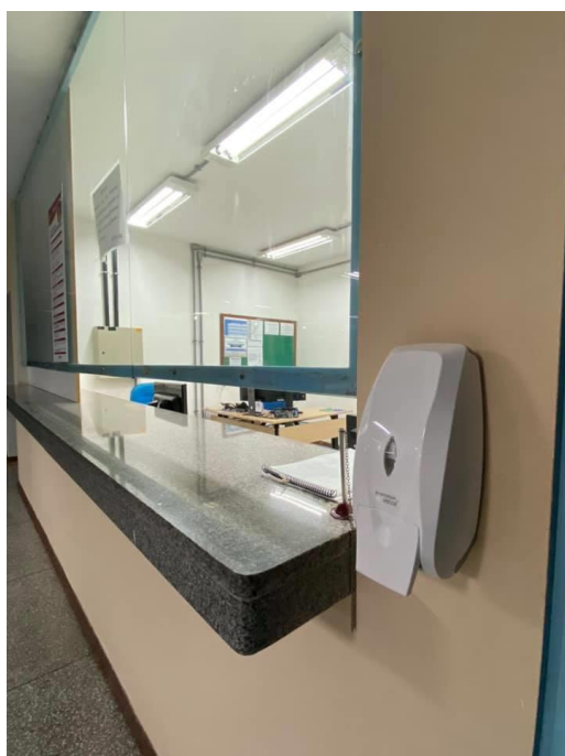
Figura 5 - Dispensadores de álcool gel